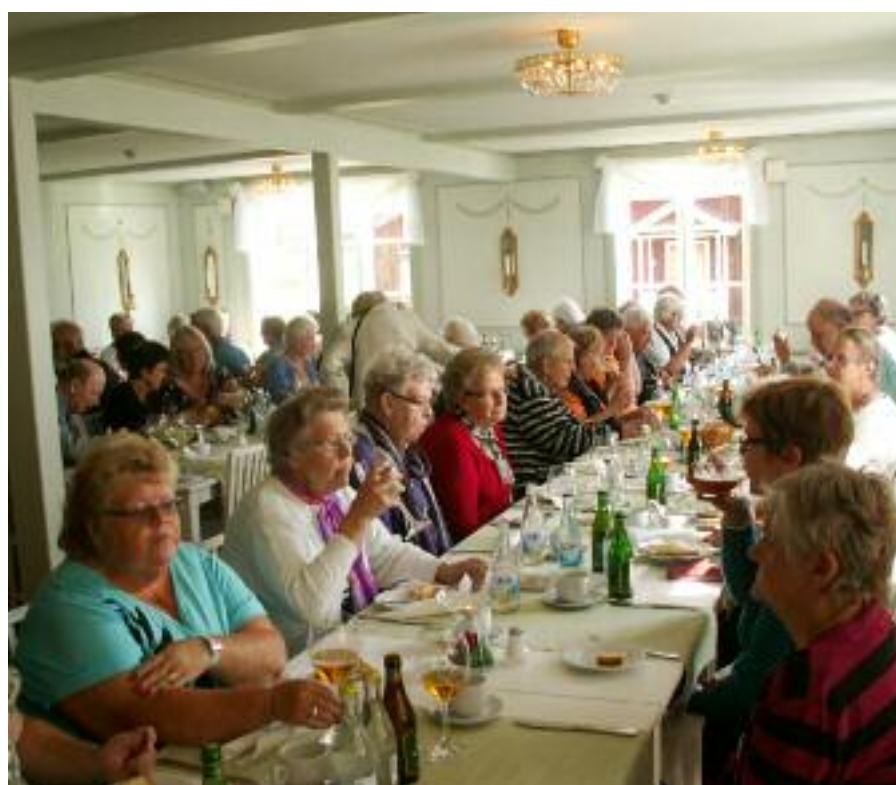
Välsmakande middag i härlig miljö i Ramkvilla.