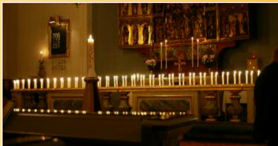
Levande ljus hör Allhelgonahelgen till. Bilden från minnesgudstjänsten i Högsby.