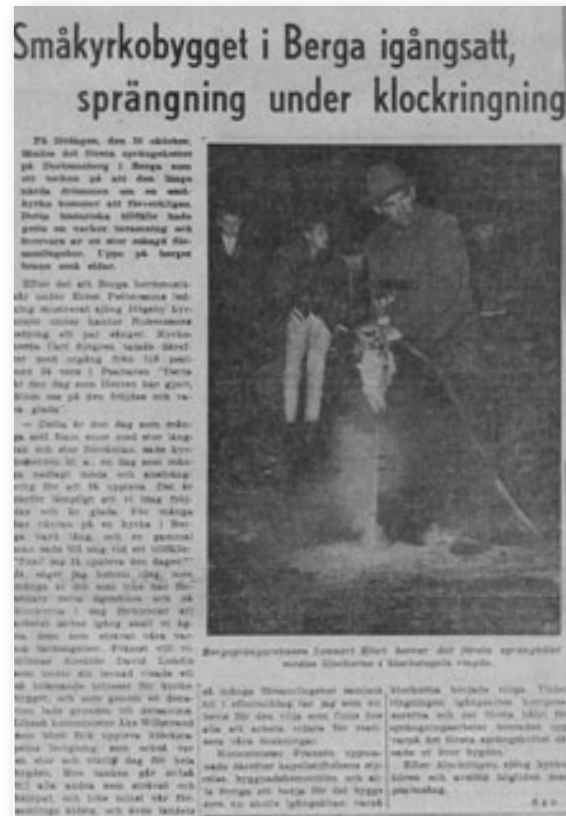
Tidningsklipp: OskarshamnsTidningen 27/10 1958

”När vi idag blickar tillbaka på det gångna decenniet, kunna vi konstatera att kyrkan varit till stor välsignelse och väl fyllt sin uppgift. Där har hållits välbesökta gudstjänster. Under denna tioårsperiod har det varit mellan femtiofem och sextiotusen gudstjänstbesökare. Där har barn undfått dopet och brudpar vigts inför altaret, konfirmander har undervisats och konfirmerats, Herrens heliga nattvard har utdelats. Jordfästningar har ägt rum. Söndagsskole- och lägerverksamhet, samt olika slags hobbyverksamhet har förekommit, de gamlas dag har firats, syföreningarna har samlats till arbetsmöten och samkväm och kyrkokören har övat.”