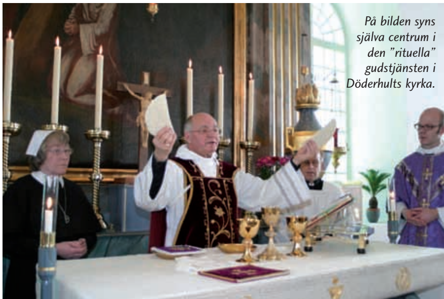
På bilden syns själva centrum i den ”rituella” gudstjänsten i Döderhults kyrka.

När aposteln Paulus, som skriver Första Korinthierbrevet, bl a på grund av den o-ordning, som tycks