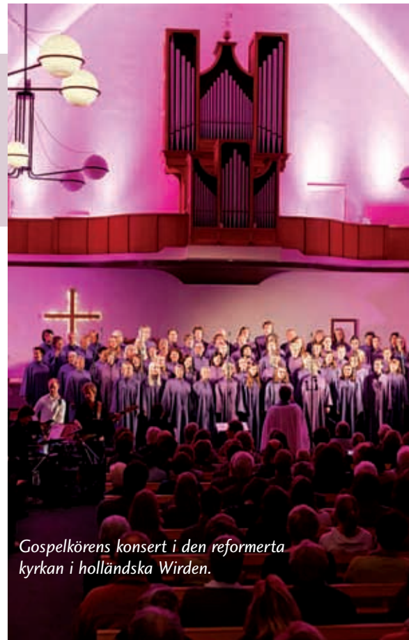
Gospelkörens konsert i den reformerta kyrkan i holländska Wirden.