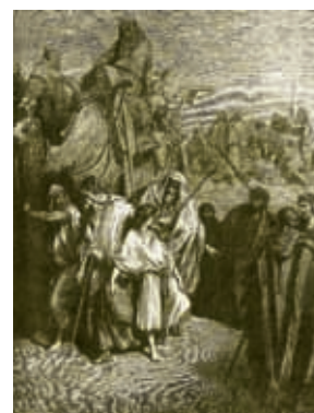
Josef säljs av sina bröder. Ur Dorés familjebibel.